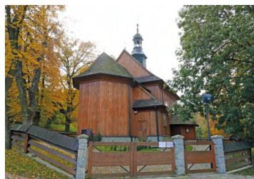
Kościół św. Sebastiana w Wieliczce

20,8 F Wieliczka, kościół pw. św. Sebastiana – drewnianą świątynię wzniesiono w 1581 r., a przebudowano w XVIII w. Z tego okresu pochodzi obraz św. Sebastiana, który umieszczono w rokokowym ołtarzu głównym.