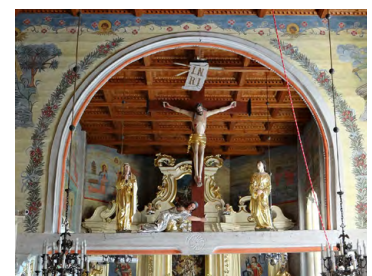
Wnętrze kościoła w Marcyporębie

19.3 F Kościół drewniany św. Marcina w Marcyporębie z 1670 r. Obiekt jest konstrukcją zrębowej, z nawą