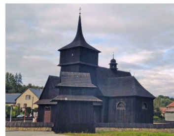
Kościół w Woznikach

A Drewniany kościół pw. Wniebowzięcia NMP w Woznikach z XVI w. W 1966 r. odbudowany po pożarze, który miał miejsce 7 lat wcześniej. Należy do nielicznej grupy drewnianych kościołów w Małopolsce posiadających odrębne wieżby dachowe dla każdej części budowli. Wewnątrz cenny drewniany krzyż z XIV w. umiesz-