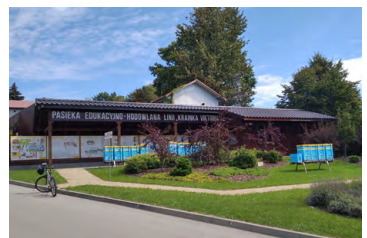
Interaktywne Centrum Pszczelarstwa Apilandia

i prezbiterium krytymi wspólnym dwuspadowym dachem. Wieża od strony kruchty została dostawiona dopiero w latach 70. XX w. Wewnątrz warto zwrócić uwagę na dwa bogato zdobione cenne portale: jeden tzw. długo-szowski, drugi manierystyczny. 20.5 Na przydrożnym stępie zielona strzałka szlaku rowerowego wskazuje nam dalszą trasę w prawo. Najpierw utwardzoną drogą, następnie gruntową dojeżdżamy do widocznego pod lasem samotnego domu. Tam odnajdujemy po lewej stronie drogę leśną, którą wyjeżdżamy na przetęcz Zapusta.