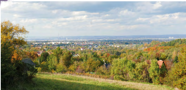
Widok na Kraków